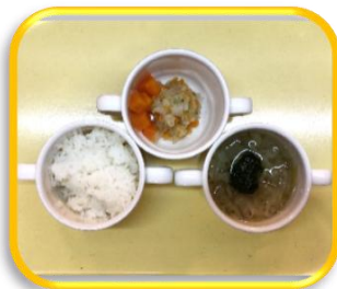
軟飯 磯和え 味噌汁