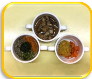
冷やしうどん かぼちゃの焼きコロッケ フルーツポンチ