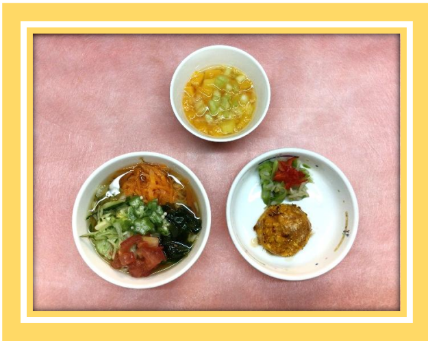
七夕そうめん 焼きコロッケ 添え野菜 フルーツポンチ