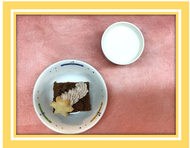
お星さまケーキ 牛乳

今日は七夕メニューです。 かぼちゃのやさしい甘さがおいしいコロッケです。かぼちゃをじゃが芋や さつま芋に変えても楽しめます。